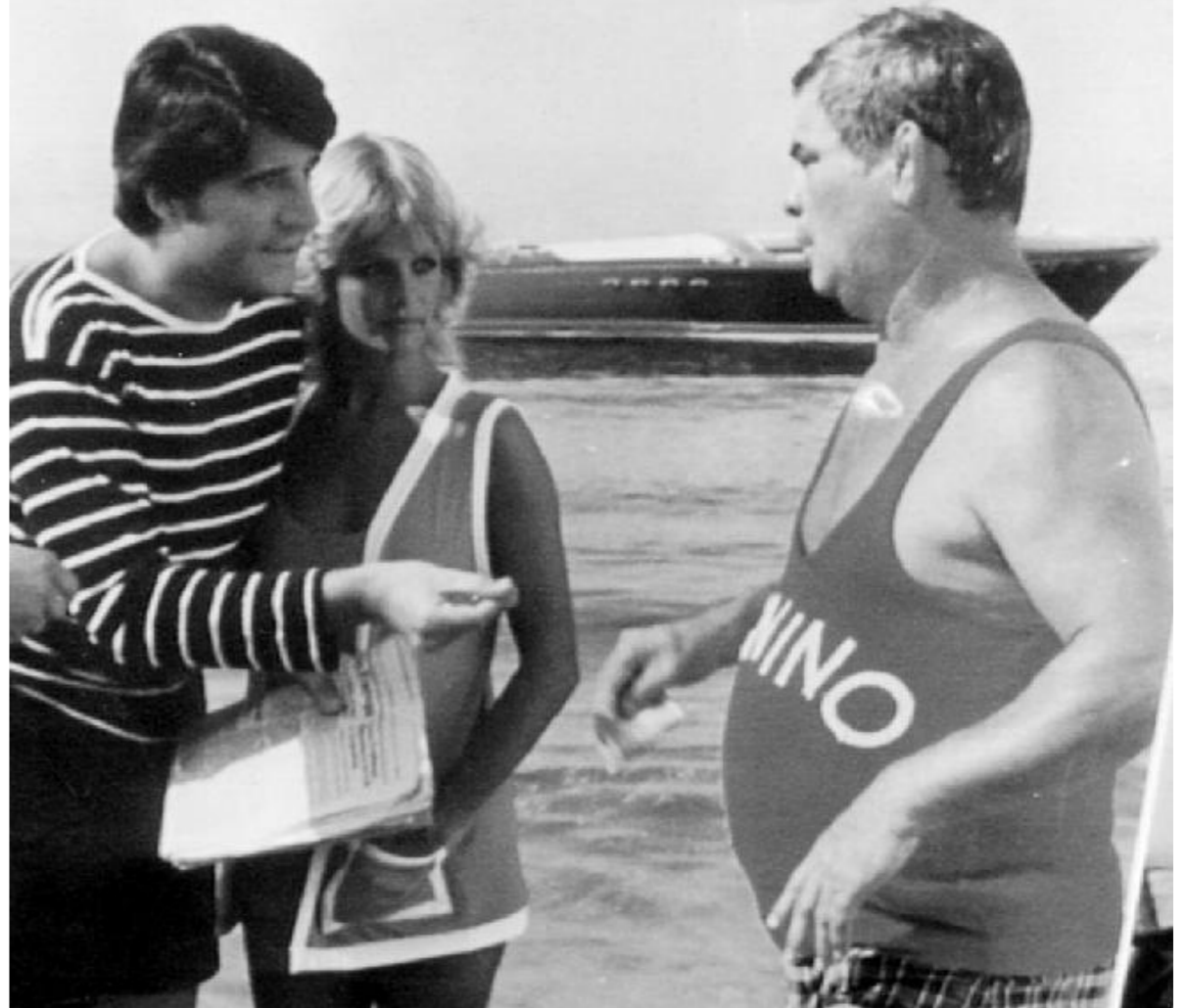
Una scena di «Sapore di Mare» di Carlo Vanzina