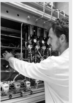
Un laboratorio per idrogeno

«Educazione al risparmio energetico e fonti rinnovabili» è il tema di un incontro organizzato dall'Istituto Artom di Asti, che si è svolto giovedì scorso. La lezione era rivolta agli studenti dell'istituto, ma anche a docenti di altre scuole, tecnici e liberi professionisti. Altri incontri del progetto «Idrogeno ed energie rinnovabili» sono in programma fra maggio e dicembre.