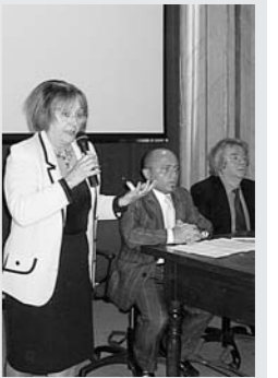
L'incontro con Manganello

Un corso per studiare il gusto. La proposta parte dall'Istituto superiore Leardi di Casale, di cui è dirigente Paola Robotti: per il prossimo anno scolastico ha messo in cantiere l'attivazione di un corso sperimentale dedicato alle discipline gastronomiche nell'ambito del corso turistico. Per far conoscere ai ragazzi delle classi quarta e quinta del corso di Operatore turistico nuovi sbocchi professionali nell'aula magna «Palli» è intervenuto Vittorio Manganello, direttore dell'Università di Scienze gastronomiche di Pollenzo, meglio nota come «Università del Gusto». Tema: «Buono, pulito e giusto: La nuova gastronomia diventa Università».