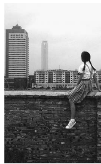
Weng Fen, On the wall-Guangzhou (2002)

Paesaggi urbani nell'arte contemporanea Palazzo Cavour, via Cavour 8, Torino. (telefono 011/53.06.90) La mostra resterà aperta fino al 2 luglio 2006. Orario: 10-19,30, giovedì 10-22, lunedì chiuso.