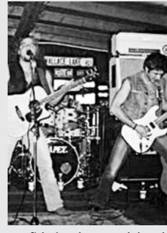
La sfida è nel segno del rock