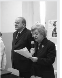
Un momento della cerimonia

Il Liceo artistico statale è stato intitolato, il 1° aprile, con una cerimonia suggestiva, al pittore vercellese Ambrogio Alciati. Alla scuola di corso Italia, nata nel 2002 per geminazione dal Liceo classico Lagrangia, la figlia dell'artista, Amelia, ha donato un autoritratto del pittore, mentre gli allievi del Liceo hanno scelto di rendere omaggio ad Ambrogio Alciati attraverso una mostra di disegni che saranno esposti sino al 1° maggio nell'auditorium di Santa Chiara in corso Libertà. Dal 5 maggio fino all'11 giugno, invece, nelle sale del museo Leone, saranno esposti dipinti e disegni del celebre ritrattista ottocentesco. Il Liceo artistico «Alciati» oggi conta dieci classi e 175 alunni. [g. mo.]