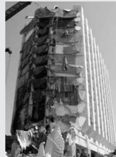
L'attentato a Taba