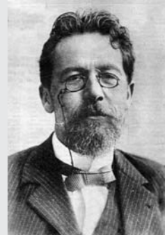
Lo scrittore Anton Cechov

Gli studenti della V del liceo scientifico tecnologico Marconi di Tortona parteciperanno alla trasmissione tv «Per un pugno di libri» che andrà in onda domenica 26, alle 18, su Rai 3. E' una gara letteraria: gli studenti si cimenteranno su «Zio Vanja» di Anton Cechov, confrontandosi con i liceali di un istituto linguistico di Prato. I ragazzi potranno avvalersi di due personaggi tv a sorpresa che li affiancheranno nelle prove. Per riuscire ad affermarsi non basta documentarsi sul libro assegnato, ma bisogna dar prova di conoscenze in campo letterario.