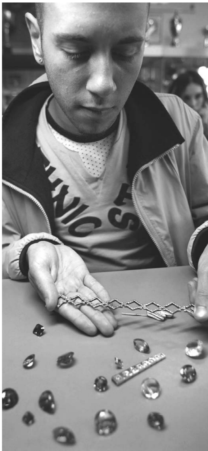
Uno studente al lavoro tra le gemme all'istituto d'arte Cellini di Valenza