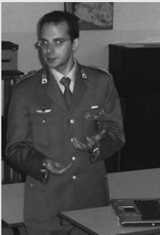
A lezione dalla Finanza

Contraffazione e pirateria informatica sono stati gli argomenti affrontati in questo primo scorcio di anno scolastico da varie classi di istituti della provincia di Alessandria (da Casale ad Acqui a San Martino di Rosignano) in incontri con ufficiali della Guardia di Finanza. Agli studenti le Fiamme Gialle hanno illustrato le sanzioni per chi produce e acquista merce contraffatta, compresi software e Cd.