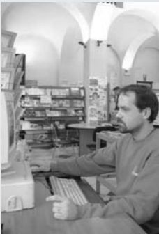
L'informagiovani di Cuneo

Un nuovo servizio dedicato agli studenti: il Comune di Cuneo propone, fino al 31 dicembre, la possibilità di collegarsi gratuitamente a Internet. Le postazioni sono nei locali dell'Informagiovani al pianterreno di palazzo San Giovanni, in via Roma 2. Per accedere al servizio è necessario prenotare il giorno e l'ora di utilizzo allo 0171/444421: ogni utente avrà a disposizione mezz'ora di navigazione in rete.